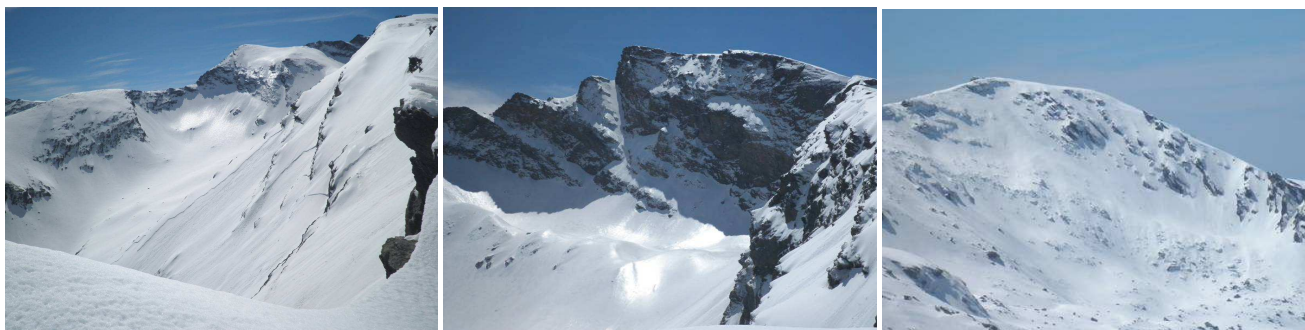
Corral del Veleta y Catujo 25-3-14