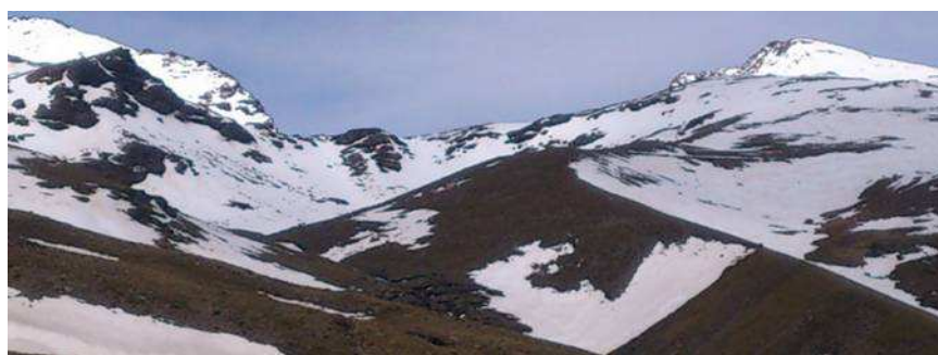
La Campiñuela en Trevélez 25-3-14