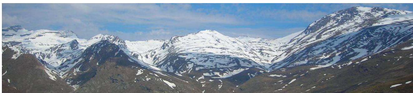
Cara sur del Veleta al Mulhacén 19-3-14