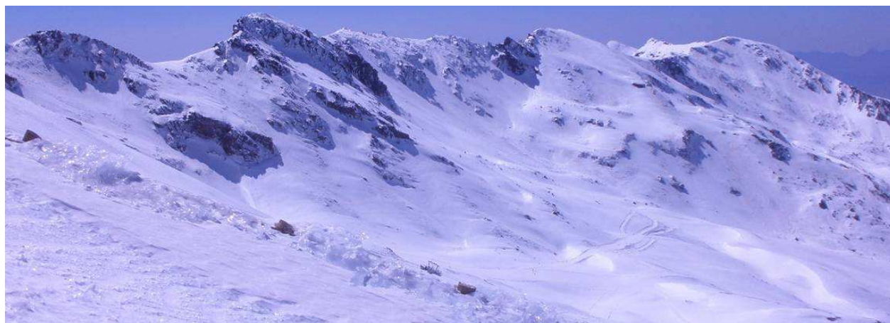
Tajos de la Virgen 18-3-14