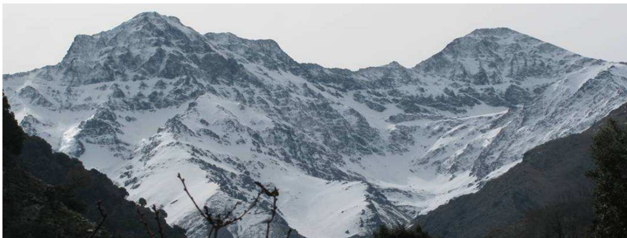
Alcazaba y Mulhacén 17-3-14