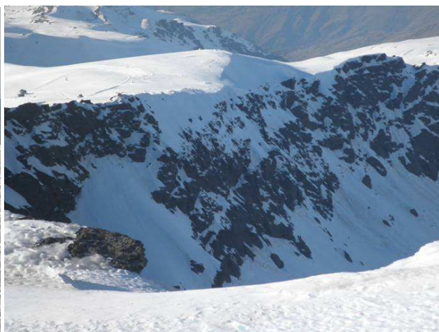
Hielo por encima de 2800metros y Veredón Superior