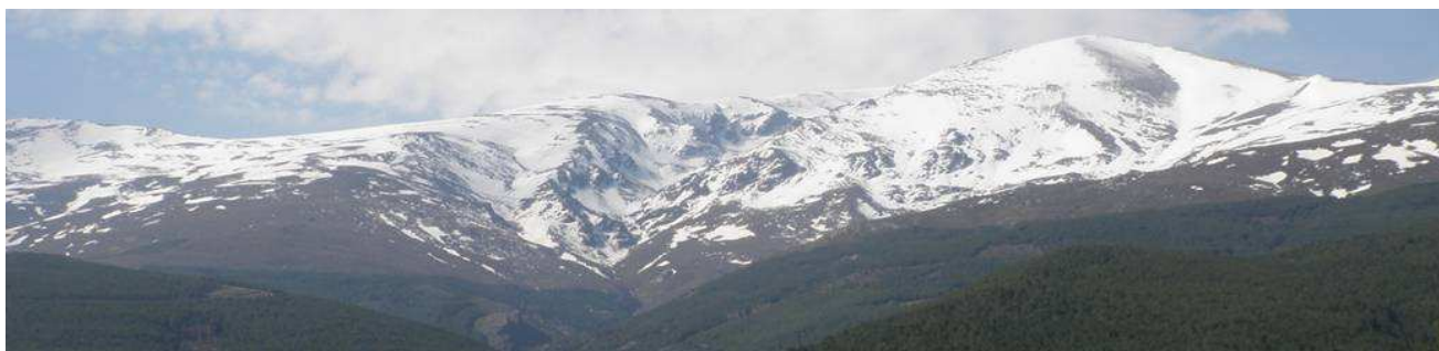
Picón de Jérez 19-3-14