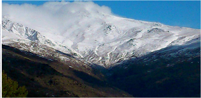
Alcazaba, cara norte y Mulhacén, cara sur 12-2-14