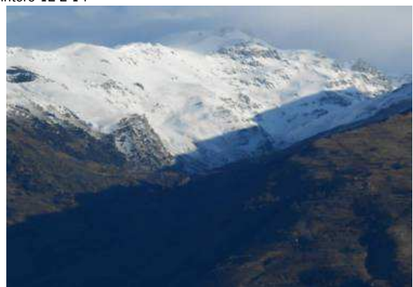
Cerrillo Redondo, Cañar y cara sur Caballo 12-2-14