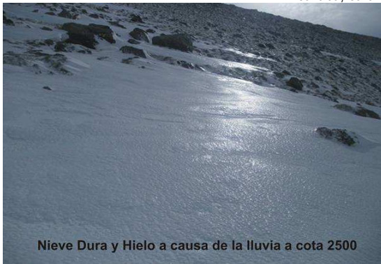
Nieve Dura y Hielo a causa de la lluvia a cota 2500