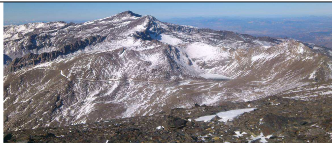
Veleta cara sur 3-12-13