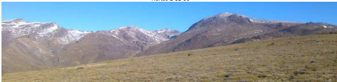
Cara sur 3-12-13