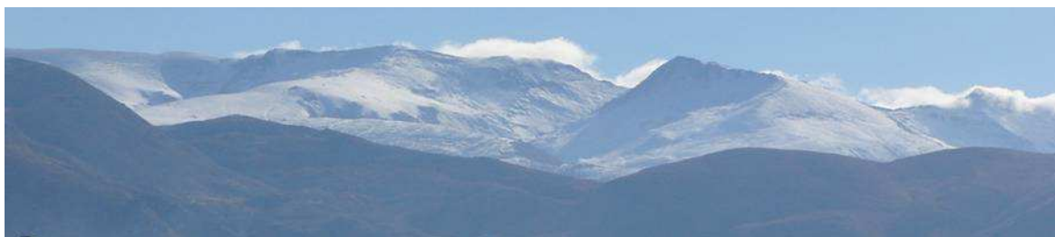
Cara norte zona occidental 4-12-13