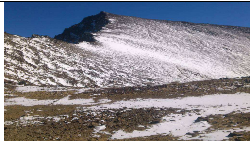
Mulhacén cara oeste 3-12-13