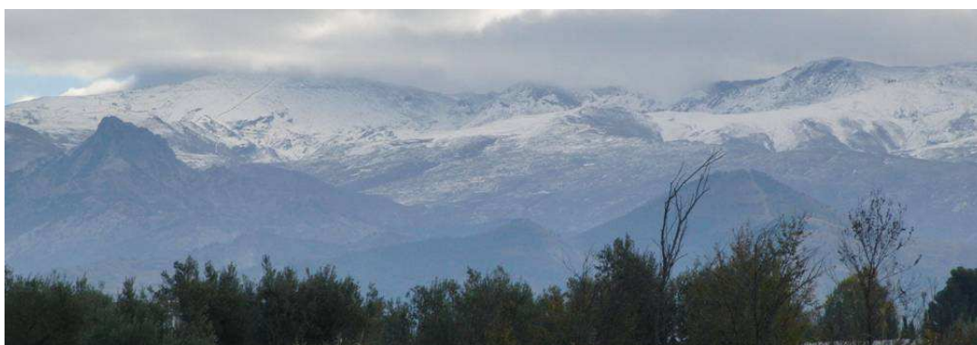
Zona occidental 28-11-13