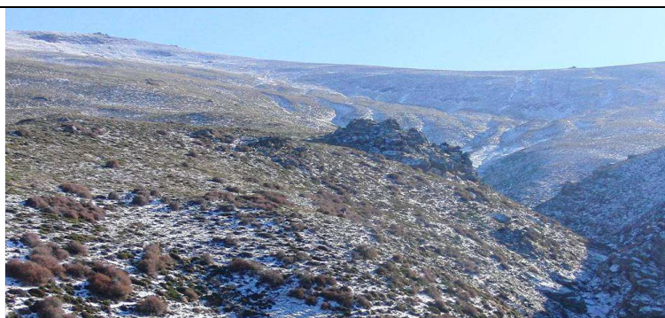
Cuerda de los Morrones 27-11-13