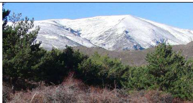
Picón de Jerez 27-11-13