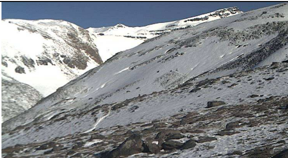
Web cam refugio Poqueira 2-5-13