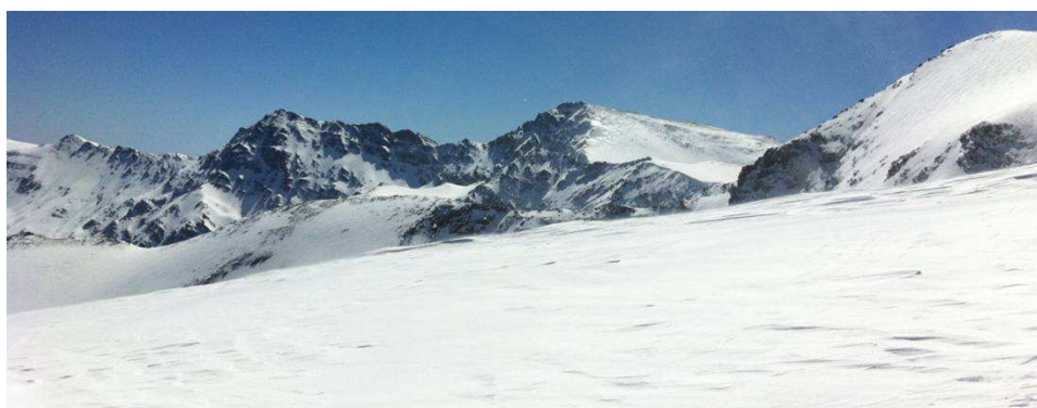
Alcazaba y Mulhacém, 1-5-13