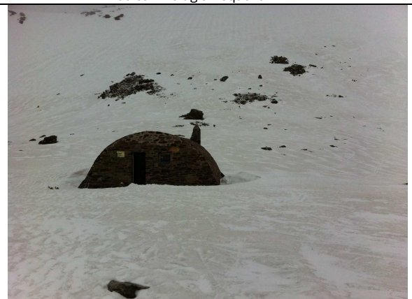
Refugio de la Caldera 29-4-13