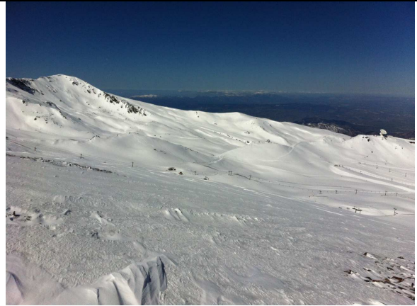
Arista Cartujo y estación de esquí 1-5-13