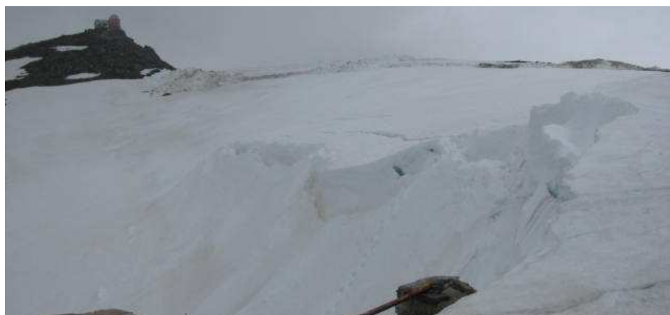
Alud en ciernes en la Hoya de la Mora 26-4-13