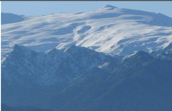
Caballo y Alayos 1-5-13