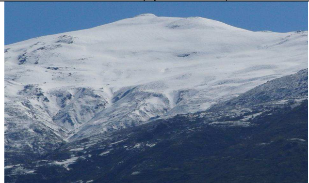
Caballo cara suroeste 1-5-13