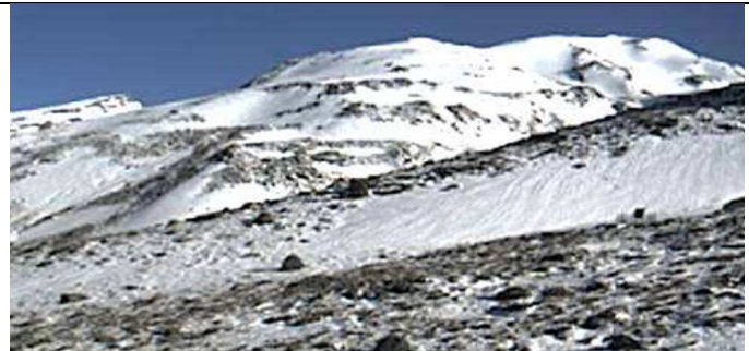
Web cam refugio Poqueira 2-5-13