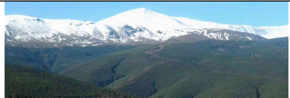
Morrón San Juan 23-3-13