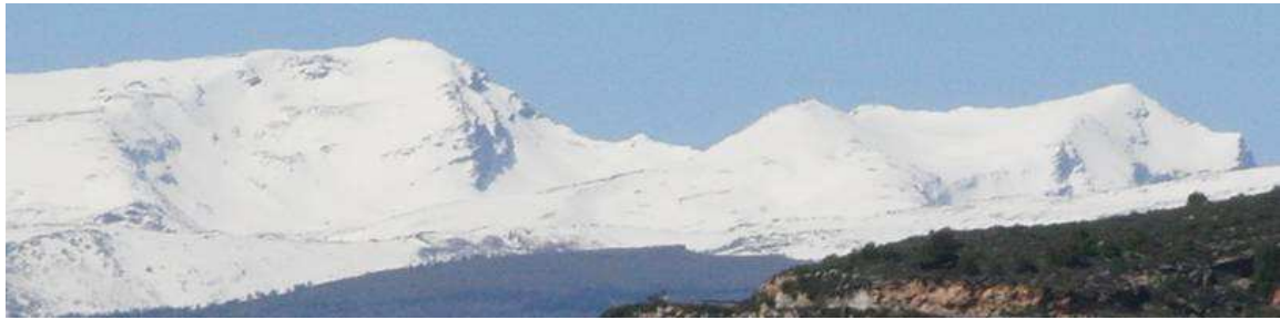
Alcazaba y Mulhacén, cara este 23-3-13