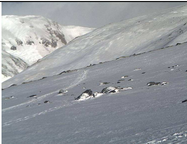
Web Cam refugio Poqueira 27-3-13