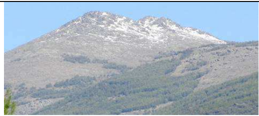
Cara sur Almirez 23-3-123