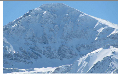
Mulhacén cara norte 23-3-13