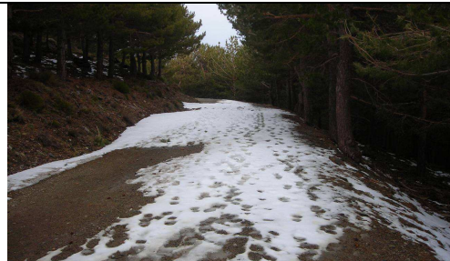
Hoya del Portillo 26-3-13