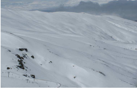
Loma de Dílar 26-3-13