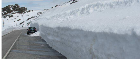
Hoya de la Mora 26-3-13