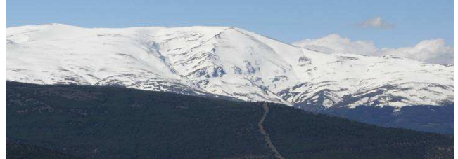
Picón de Jerez