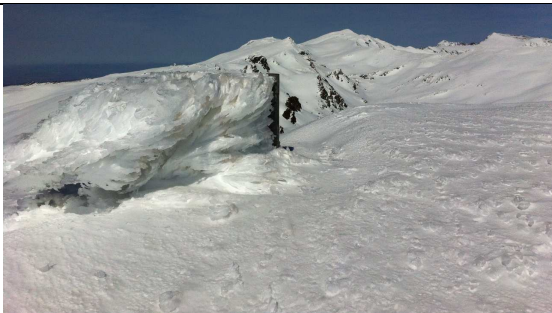
Cumbre del Caballo 23-3-13