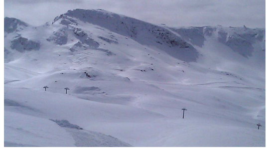
Tajos de la Virgen 23-3-13