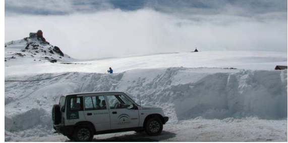
Hoya de la Mora 26-3-13