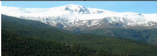
Morrón del Mediodía