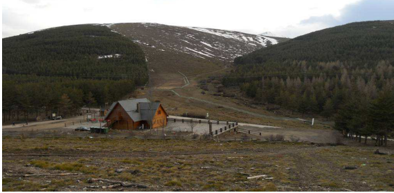
Puerto de la Ragua 26-3-13