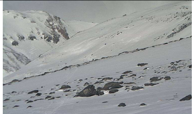
Web cam Refugio Poqueira 21-2-13