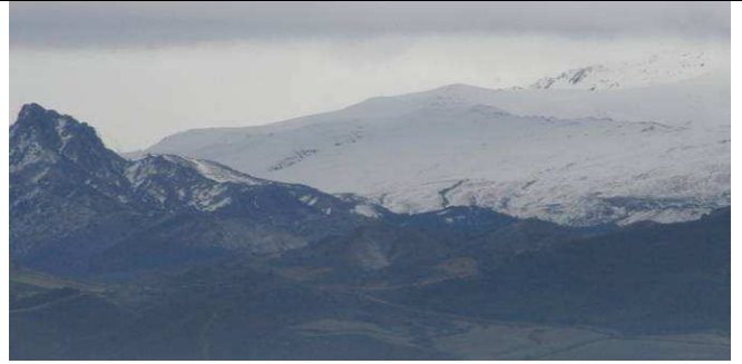
Trevenque y loma Veleta 21-2-13