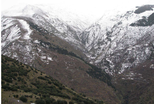
Cabecera río Genil 20-2-13