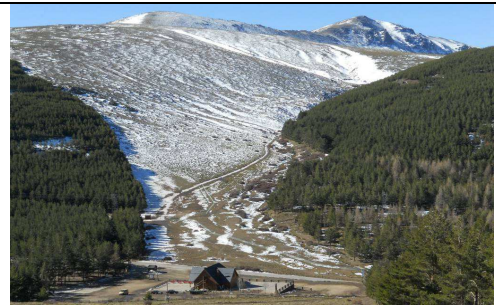
Puerto de la Ragua 18-2-13