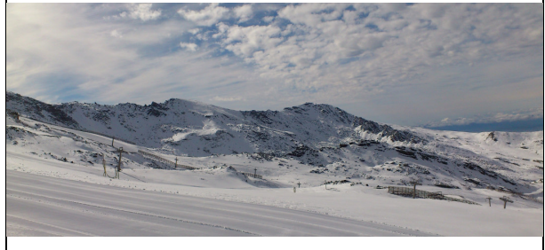
Tajos de la Virgen - Cartujo (3) Fecha Imagen: 21/11/2012