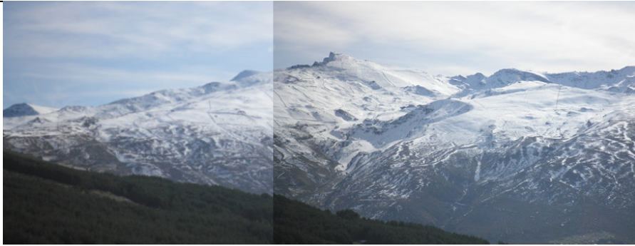
Veleta (1) Imagen: 21/11/2012