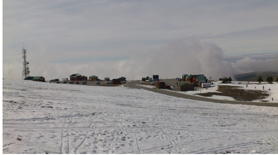
Hoya de la Mora (2) Imagen: 21/11/2012