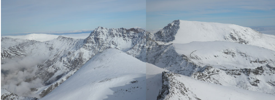
Machos, Alcazaba y Mulhacén (4) Fecha imagen: 21/11/2012