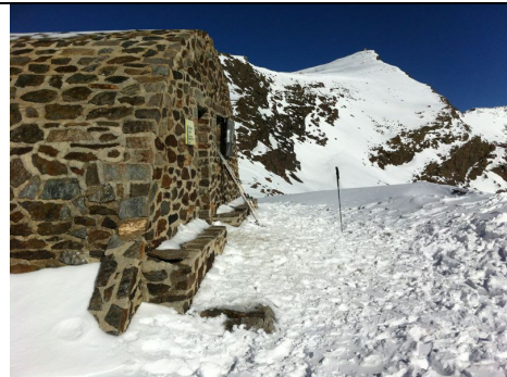
Refugio vivac Carihuela (6) Fecha imagen: 22/11/2012