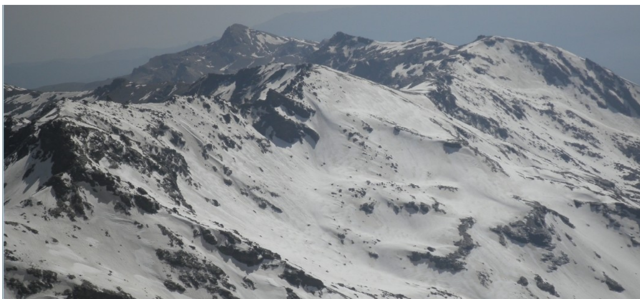
Desde los Tajos de La Virgen al Caballo 26-5-21