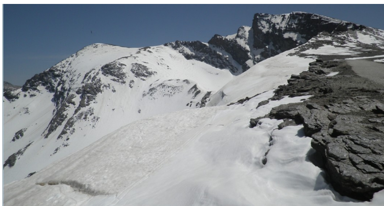
Alcazaba y Corral del Veleta 26-5-21