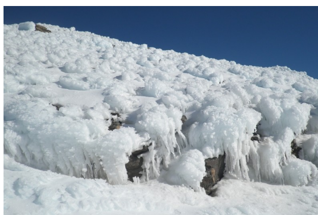
Carihuela del Veleta 22-12 -20

Mucha precaución, mucho hielo durísimo. Imprescindibles crampones y piolets Atención, es mejor desistir de realizar cualquier actividad si no se tienen conocimientos y práctica de experto en montaña en estas condiciones, desgraciadamente ya ha habido un accidente mortal.