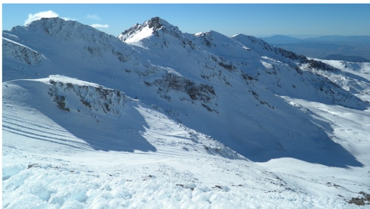
Corral del Veleta y Tajos de La Virgen 22-12-20