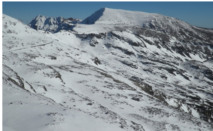
Alcazaba y Mulhacén desde La Carihuela 22-12-20