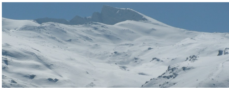
Alcazaba, Mulhacén y Veleta 21-1-20