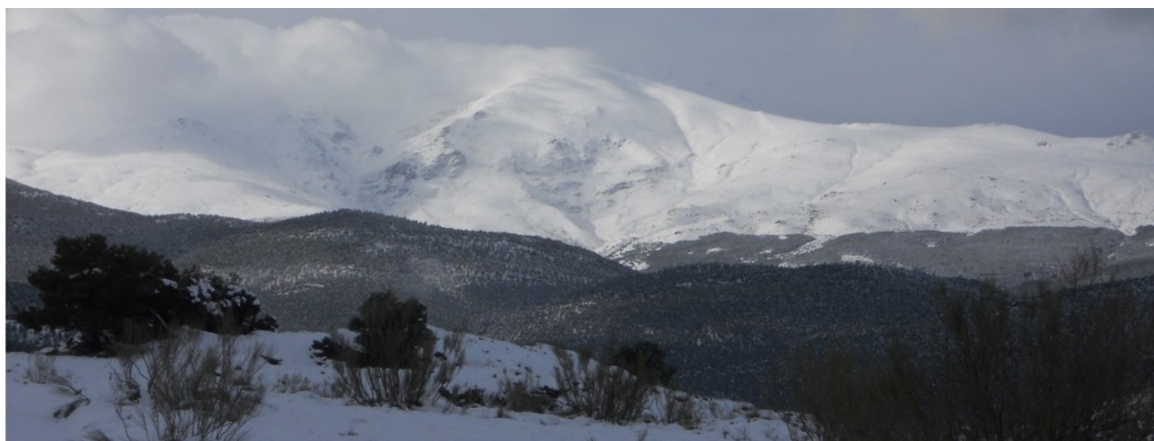
Picón de Jérez 23-1 -20