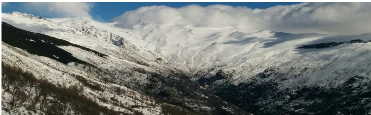
Barranco Poqueira 21-1 -20