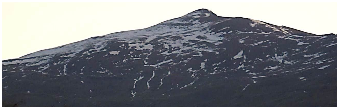
Caballo y Picón de Jéres 1-2-20