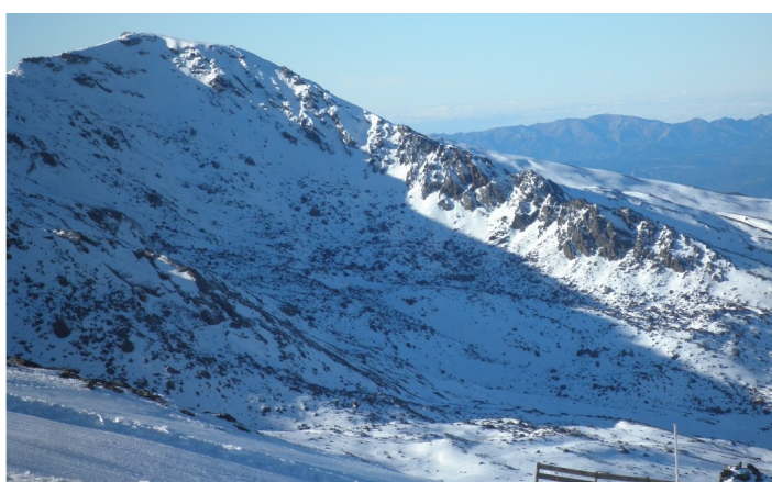
Veleta y arista Cartujo 31-12 -19