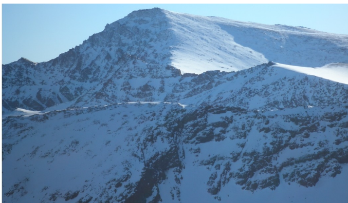
Alcazaba y Mulhacén 31-12-19