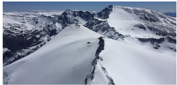
Corral y cumbre del Veleta 2 – 5 -18

¡Atención ! Se están produciendo numerosos aludes por la zona más alta y además hay túneles de hielo en cabeceras de ríos y arroyos se aconseja extremar la precaución