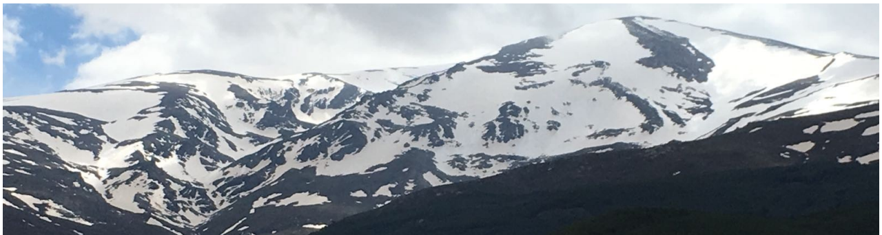
Picón de Jérez 2-5-18