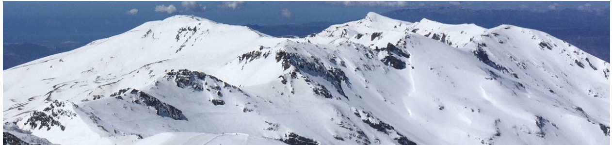
Desde La Carihuela hasta el Caballo 2 – 5 -18

¡Atención ! Se están produciendo numerosos aludes por la zona más alta y además hay túneles de hielo en cabeceras de ríos y arroyos se aconseja extremar la precaución