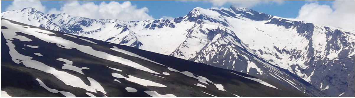
Corral del Veleta, Veleta y Cartujo 23 - 5 -18