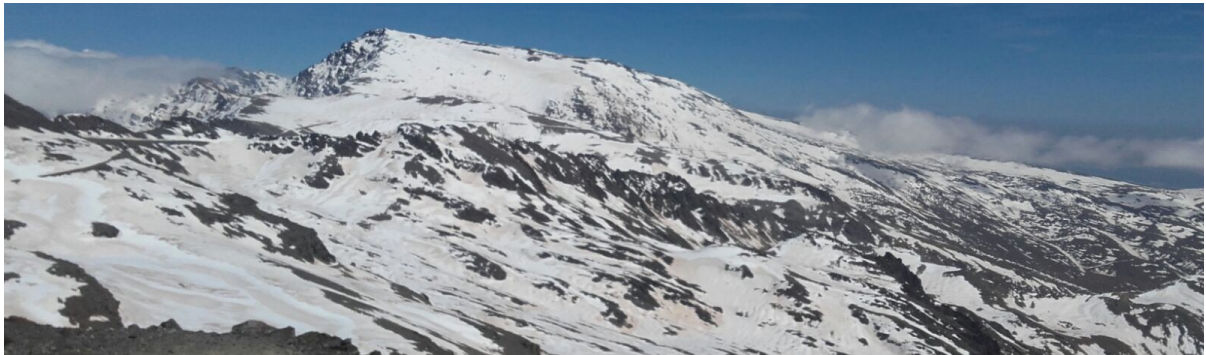
Mulhacén desde la Carihuela 30 -3-17