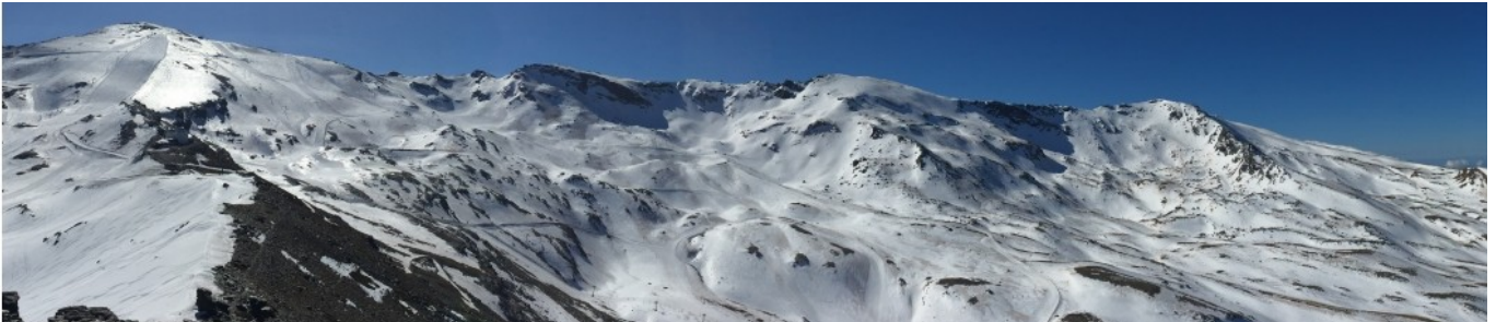
Del Veleta al Cartujo 30 - 3 - 17