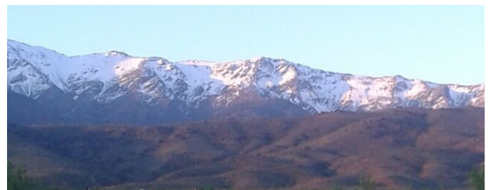
Picón de Jérez y vertiente norte almeriense 30-3-17