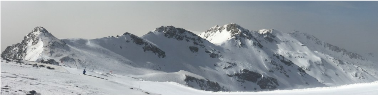
Tajos de la Virgen 21-2-17