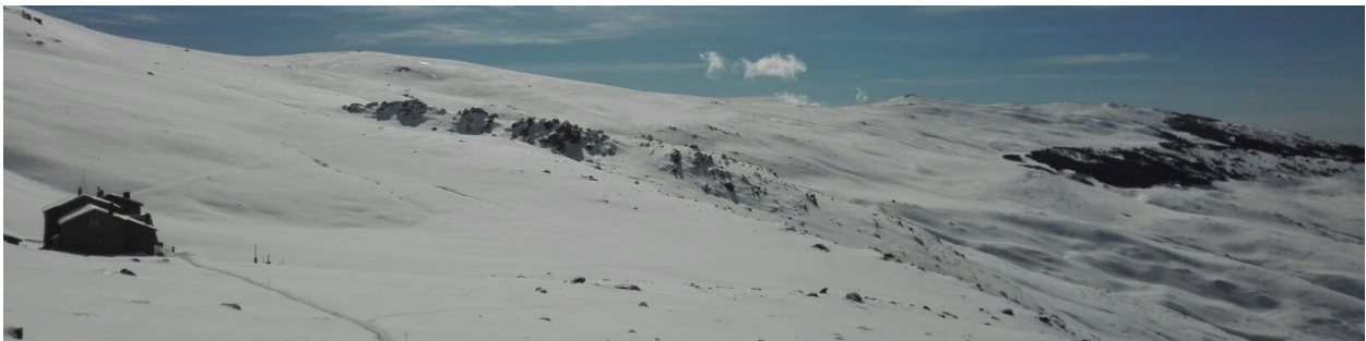
Alrededores refugio Poqueira 19-2-17