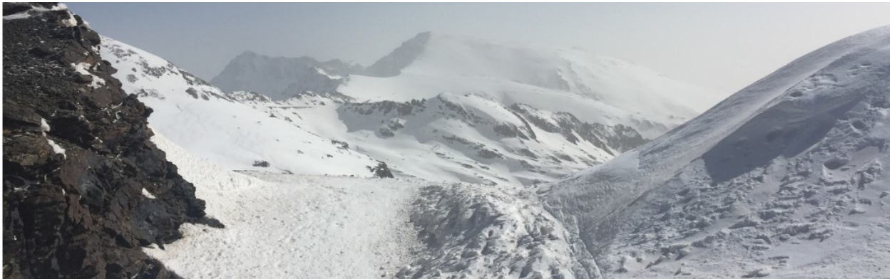
Cara sur desde La Carihuela 21-2-17