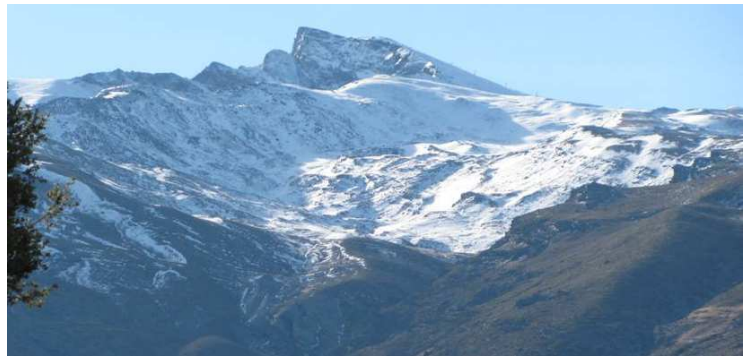
Zona estación de esquí y cabecera Barranco San Juan 19-1-16