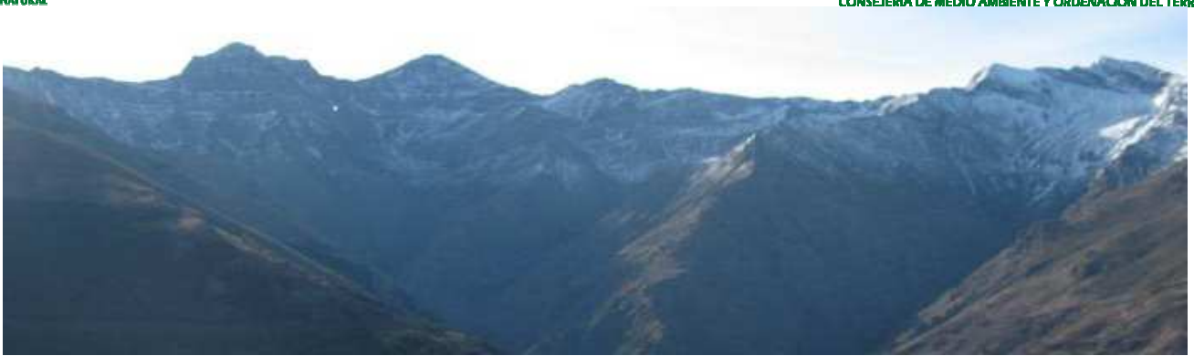
Vertiente norte de la Alcazaba al Veleta 19-1-16