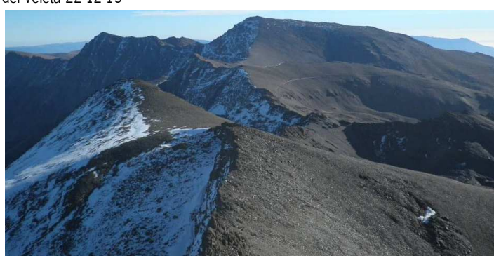
Tajos de la Virgen y divisoria desde el Veleta 22-12-15