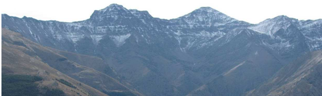
Cara norte Alcazaba y Mulhacén 22-12-15