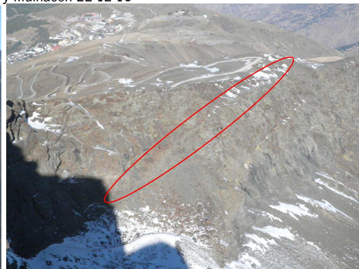
Cabecera río Monachil y acceso al corral del Veleta por el Veredón Superior 22-12-15