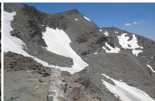
Veredón Superior, Corral del Veleta y Carihuela 30-6-15