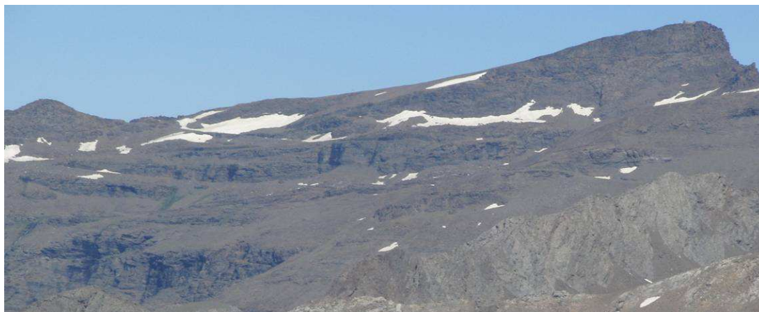
Cara sur desde loma Púa al Veleta 30-6-15