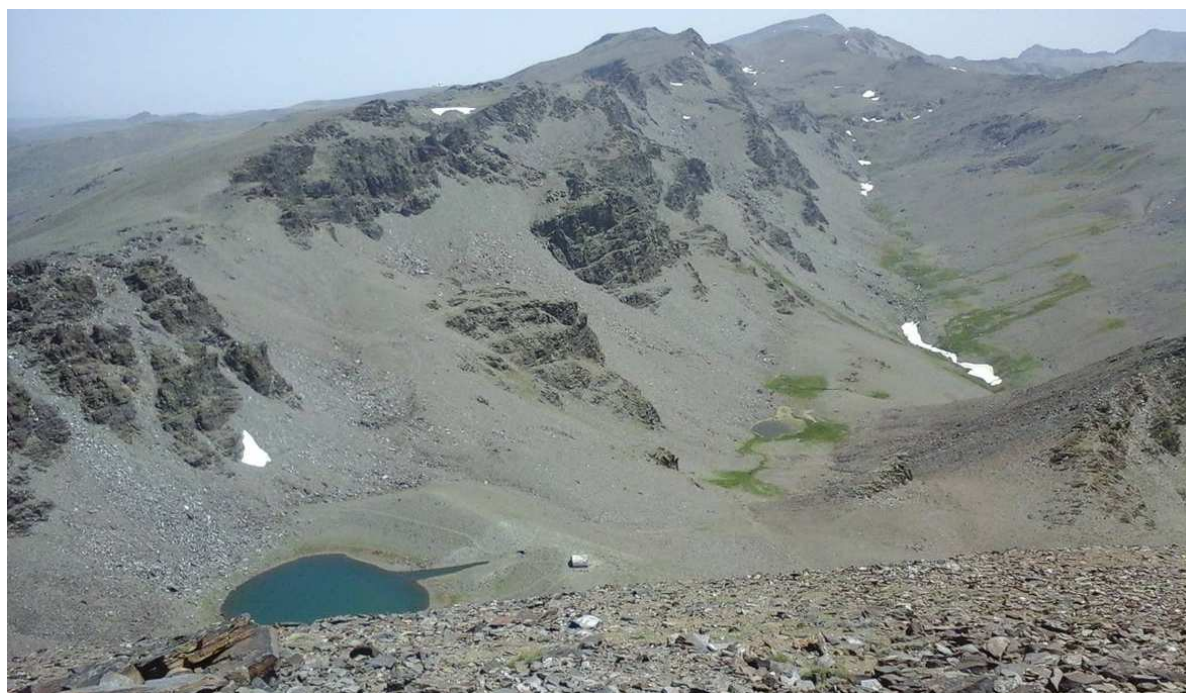
Cabecera del río Lanjarón 1-7-15