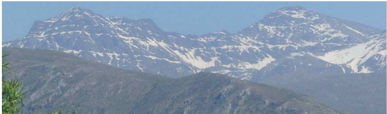
Vertiente norte Alcazaba y Mulhacén 12-5-15