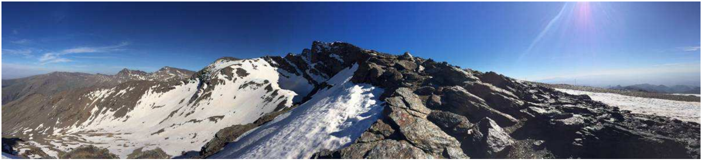
Corral del Veleta 12-5-15