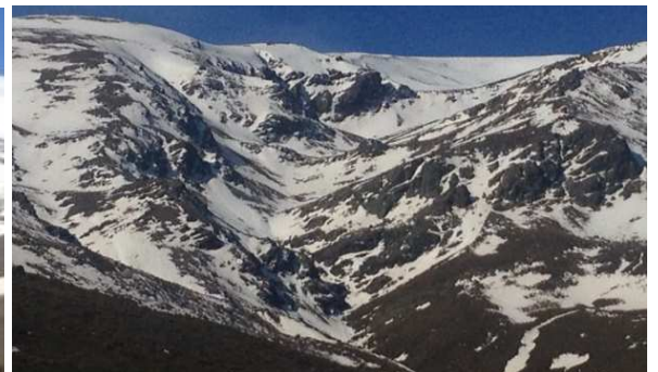
Picón de Jérez y cabecera río Alhori 30-3-15