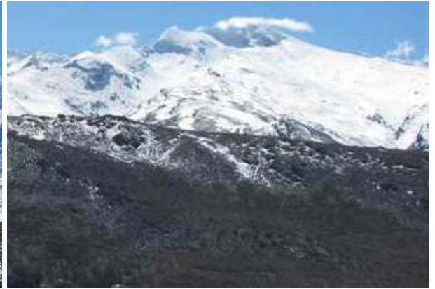
Vertiente norte Alcazaba, Mulhacén y Veleta 29-3-15