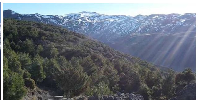
Picón de Jérez y Caballo 10-3-14