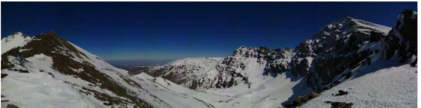
Nortes Alcazaba y Mulhacén desde collado del Ciervo 11-3-14