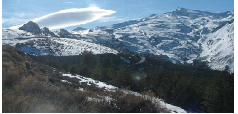
Veleta y su entorno 12-3-14