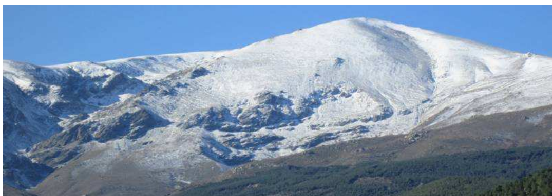
Picón de Jérez 10-11-14