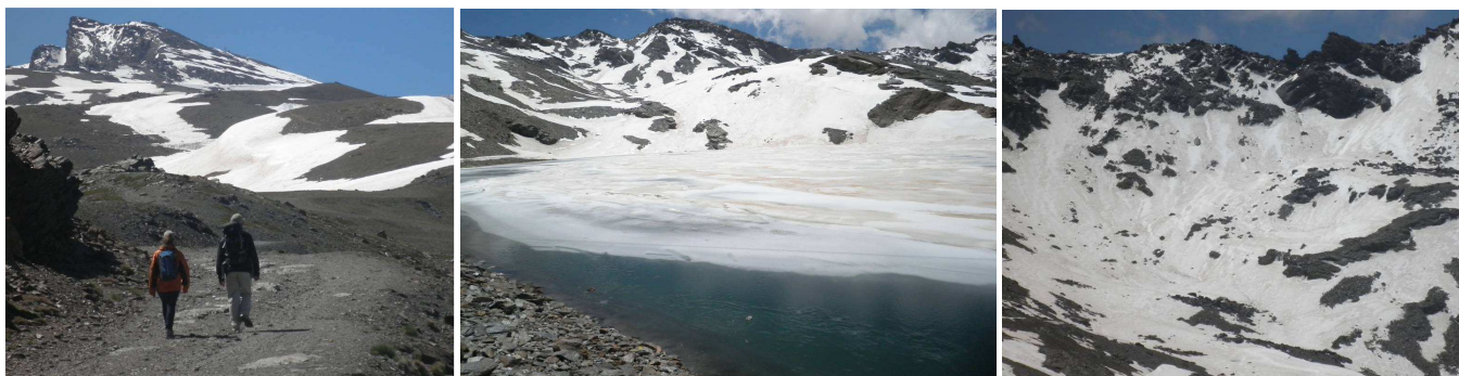
Veleta, laguna de las Yeguas y Tajos de la Virgen 28-5-14