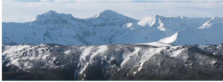
Nortes del Mulhacén y Alcazaba 2-4-13