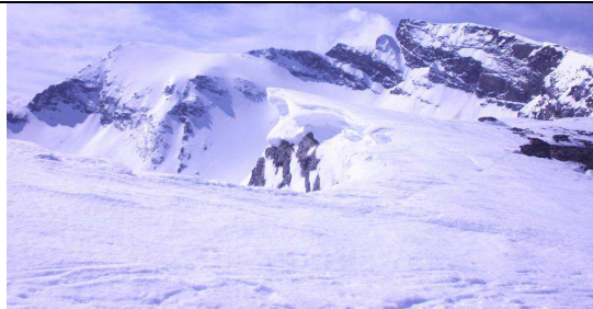
Cornisas en las Posiciones del Veleta 14-4-13