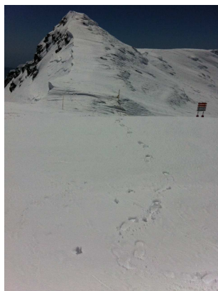
Foto tomada desde encima del refugio de la Carihuela 11-4-13