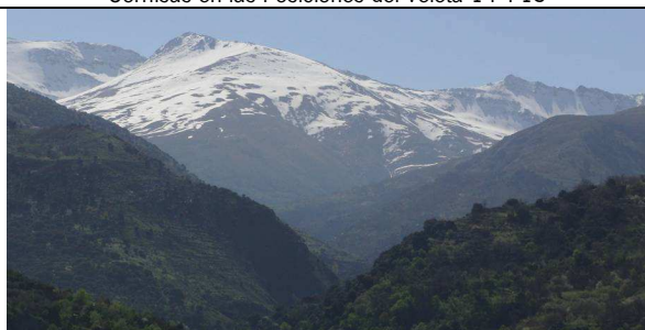
El Cuervo 17-4-13