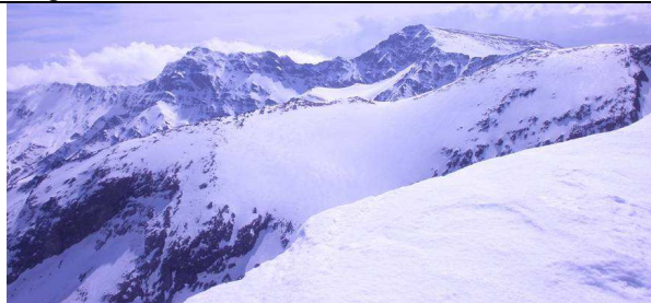
Cara norte desde Posiciones 14-4-13