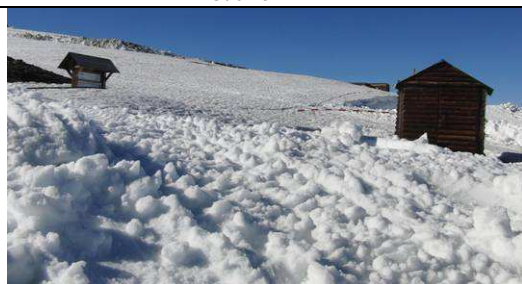
Hoya de la Mora 17-4-13